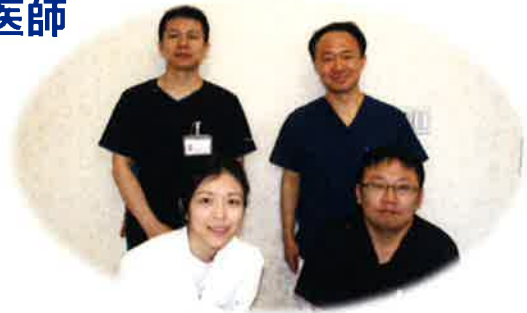
助産師・産科スタッフ