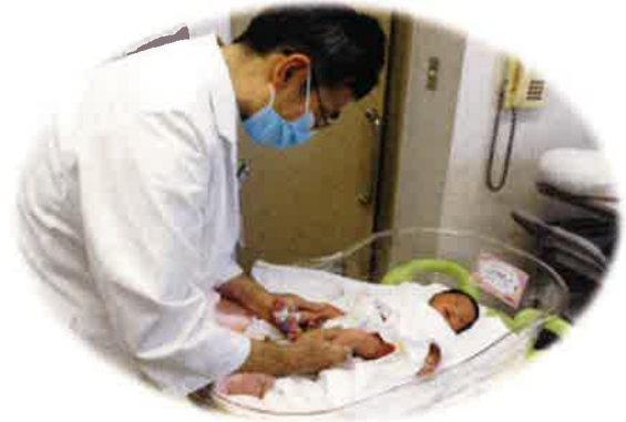
整形外科医師による診察